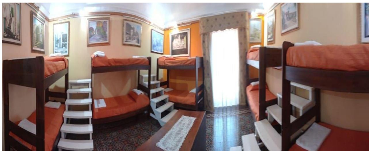
Sala espositiva di villa Pittalà Alberti. All'occorrenza, insieme ad altre sale, viene munita di letti per gli ospiti.