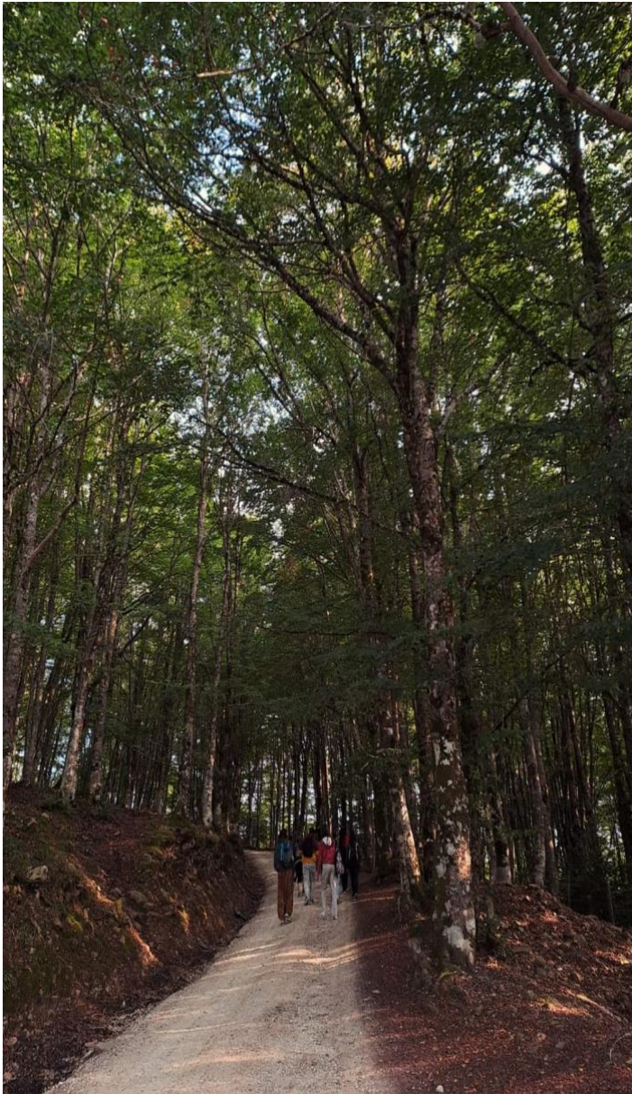
Sentiero Parco dei Nebrodi