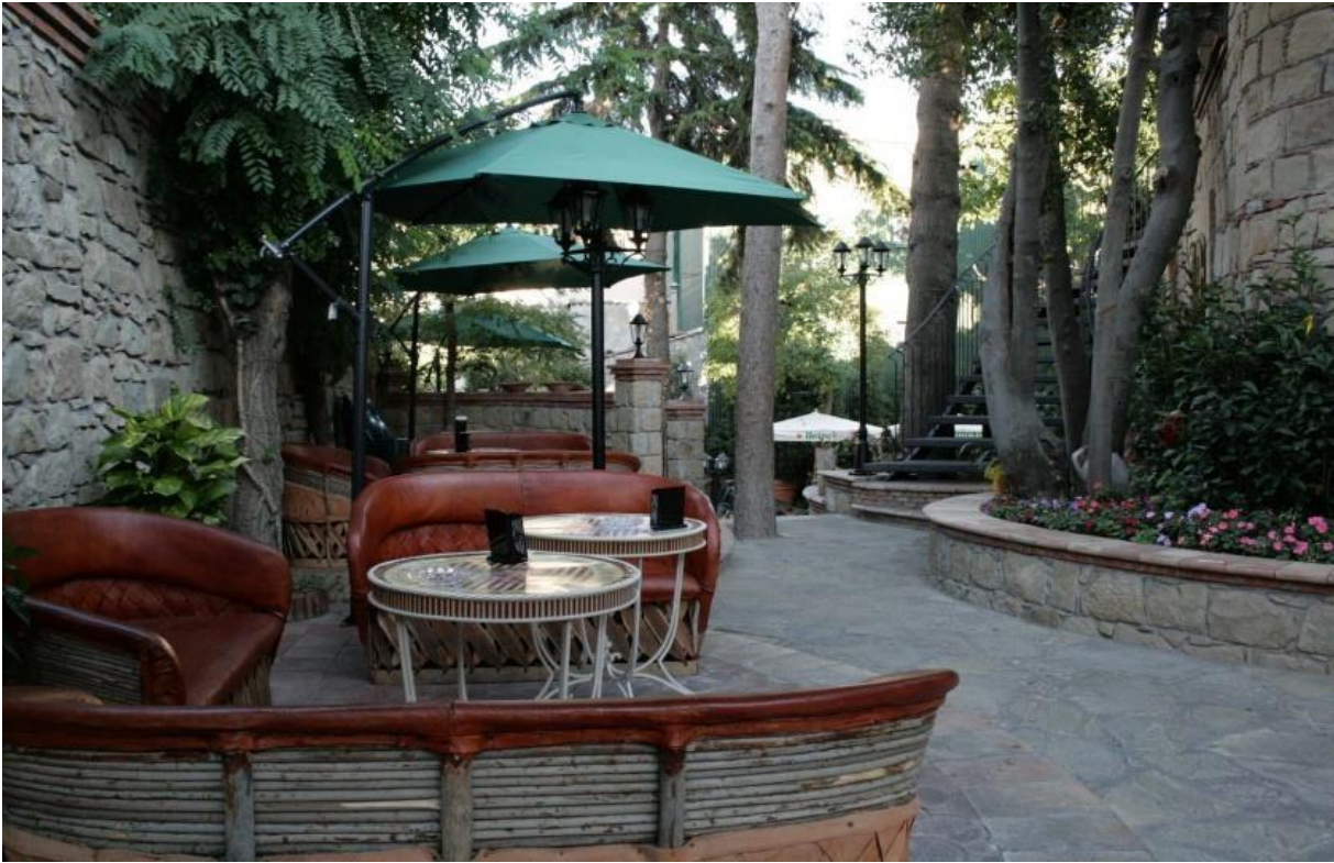
Veduta del patio-giardino di villa Pittalà Alberti.