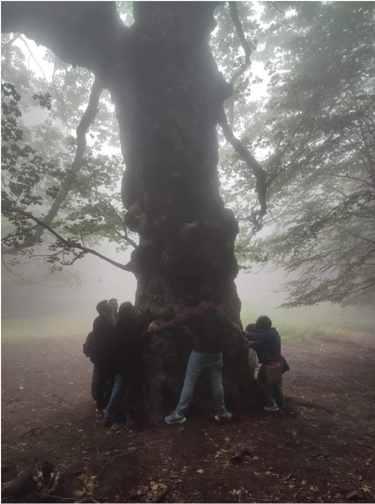
Acerone di Monte Soro