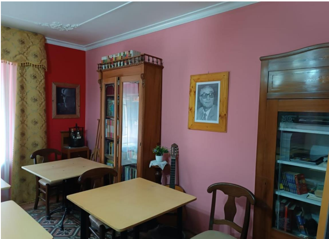
Il salotto dove avvengono gli incontri del caffè letterario G.Bufalino, iniziativa culturale della Pro loco San Teodoro.